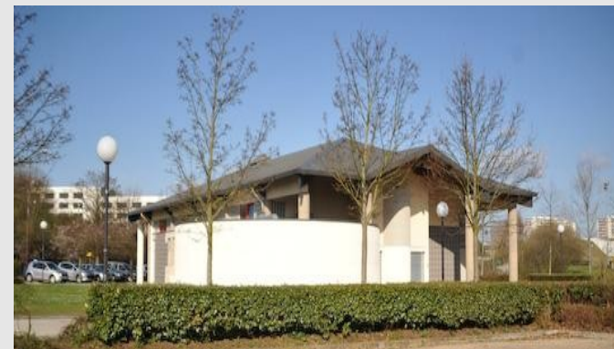
Salle Anne FRANCK de LONGJUMEAU

Direction Départementale des Territoires de l'Essonne