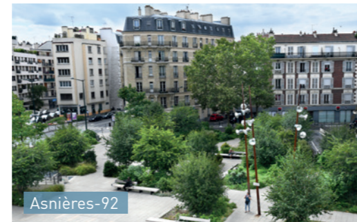
Asnières-92 Parvis de l'Hôtel de Ville partiellement désimperméabilisé en créant des espaces végétalisés.