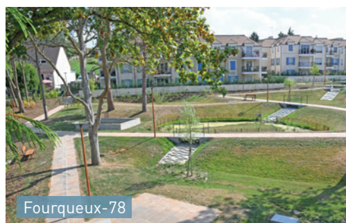
Fourqueux-78 Dans le cadre de la rénovation du parc urbain au cœur de village : alternance de bassins secs et bassin en eau au point bas du parc.