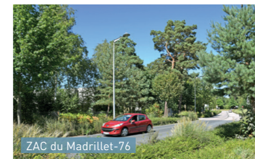
ZAC du Madrillet-76 Noue le long de la voie de circulation permettant l'infiltration des eaux ruisselées et séparation des voies de circulation et piétonne.