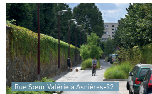
Rue Sœur Valérie à Asnières-92 Aménagements végétalisés délimitant différents espaces : voie piétonne, voie de circulation, places de parking.