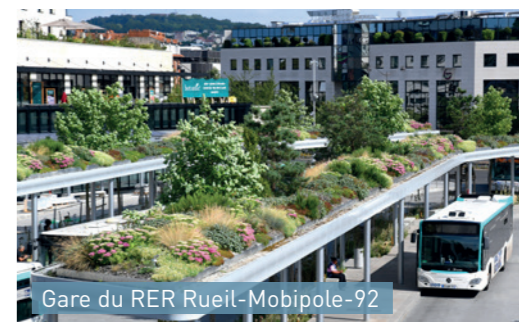
Gare du RER Rueil-Mobipole-92 Abribus et station vélos végétalisés pour un cadre de vie agréable.