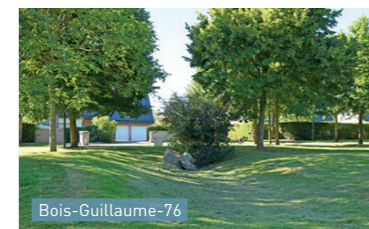
Bois-Guillaume-76 Espaces verts en creux : lieux de jeux et de vie par temps sec.