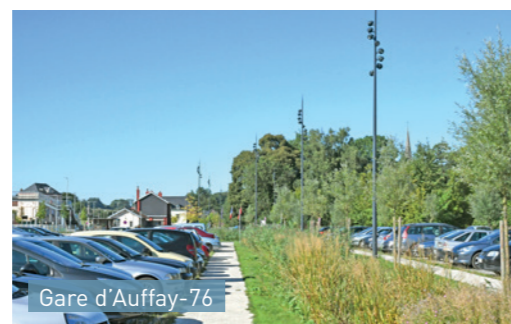
Gare d'Auffay-76 Structuration de l'espace et gestion des eaux pluviales via un parking végétalisé et une noue centrale récupérant les eaux de ruissellement.