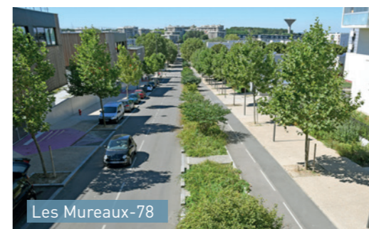
Les Mureaux-78 Noue latérale avec bordure intermittente séparant la voie de circulation et piste cyclable.