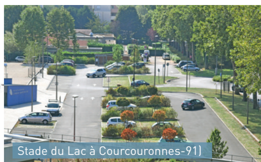
Stade du Lac à Courcouronnes-91 Parking végétalisé conçu en fonction de la fréquentation du site et structurant les différentes places.