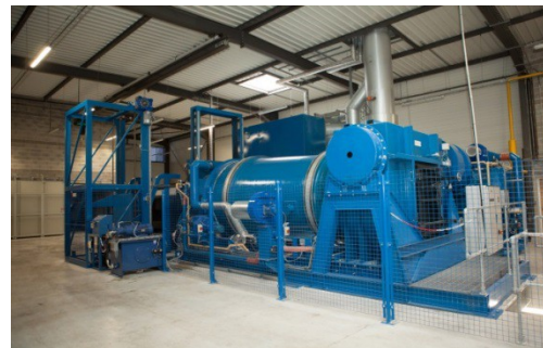
Nous le remplacerons par un four rotatif équipé d'une filtration