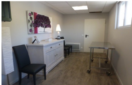
Espace non adapté au recueillement