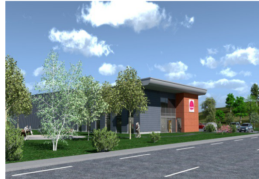
Une façade plus accueillante