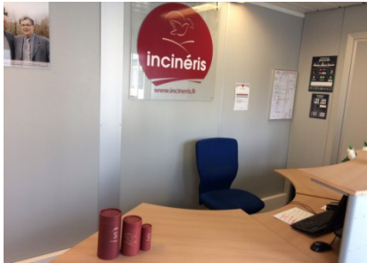
Accueil client dans un bureau modulaire de type « Algéco »