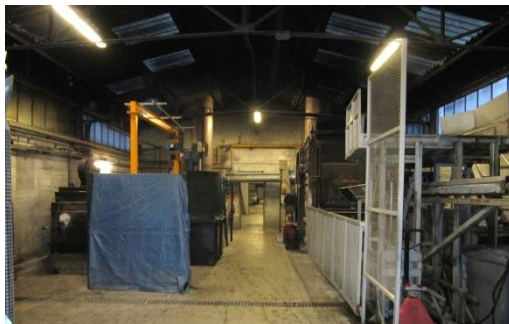
Un four statique d'une vingtaine d'année pour les crémations plurielles