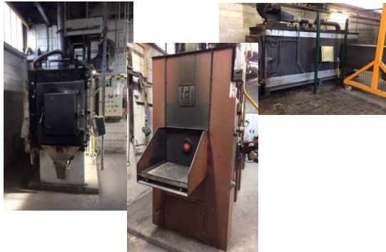
3 fours pour les crémations privées et références