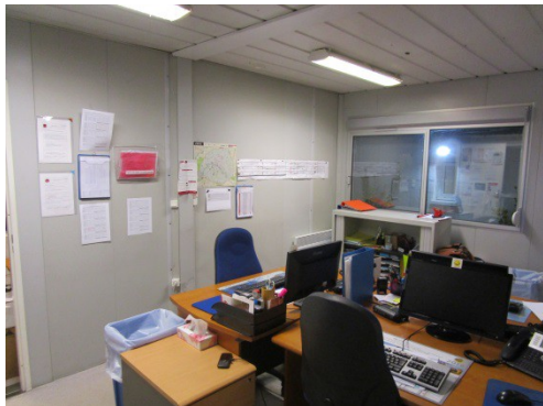
Des bureaux modulaires trop petits