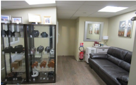
Salon exigu dans le bâtiment principal