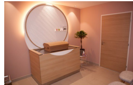
Espace pour des adieux en toute intimité