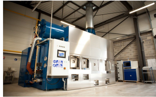
Nous les remplacerons par 2 fours FT4D