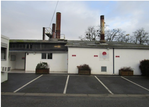
Une façade austère