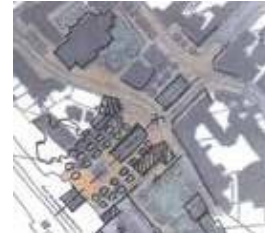
Boutigny-sur-Essonne (91) Cœur de bourg | PNR Schéma d'orientation ACE-PCE