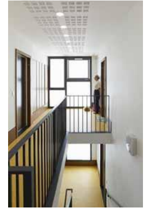
Villemaison-sur-Orge (91) I3F | G. Gribé B. Lagier, architectes

Manifester l'identité du lieu en garantissant une continuité urbaine et paysagère