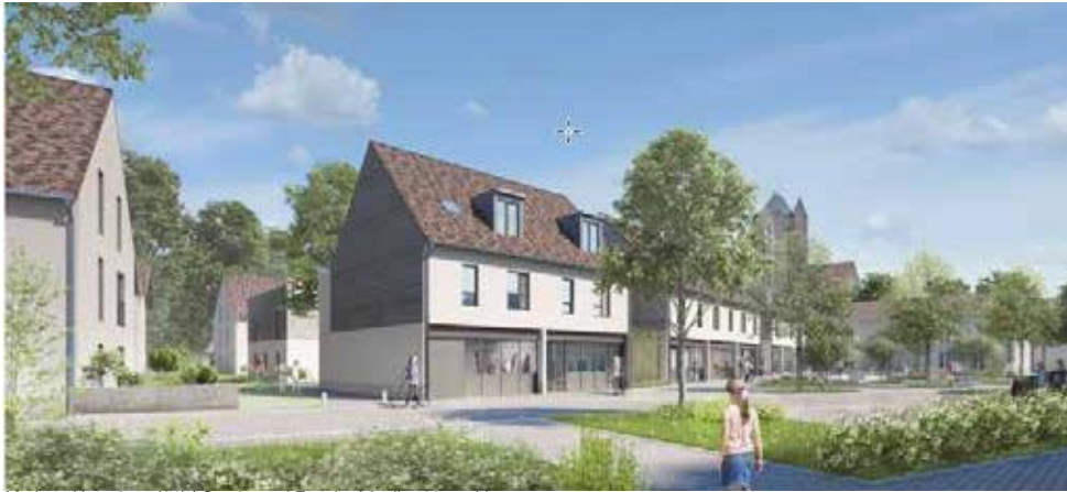
Morigny-Hampigny (91) | Continental Foncier | Atelier 68, architectes