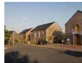
Briis-sous-Forges (91) Continental Foncier Antoine Monnet, architecte