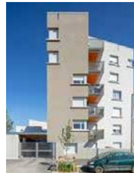
Brétigny-sur-Orge (91) ZAC Clause Bois Badeau Bouygues Immobilier Vincent Cornu, architectes