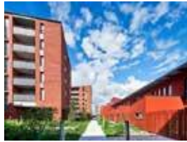
Brétigny-sur-Orge (91) ZAC Clause Bois Badeau I3F | Emmanuelle Colboc et associés, architectes | Co-Be, paysagistes

Aux élus et leur service Aux porteurs de projets Aux Maîtres d'Ouvrage Aux bailleurs sociaux Aux Maîtres d'Œuvre Aux agents de la DDT