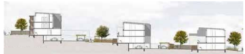
Villemaison-sur-Orge (91) | I3F | G. Gribé B. Lagier, architectes

Répondre aux exigences de la ZAN (Zéro Artificialisation Nette) dans le cadre des dérèglements climatiques