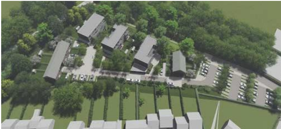
Milly-la-Forêt (91) | Continental Foncier | Studio Nemo, architectes

Ils exercent un rôle pédagogique en amont des opérations et permettent une évolution qualitative.