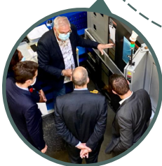
PDMK, Nozay, 30/06