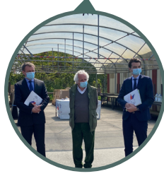
Secours populaire, Ballainvilliers, 22/04