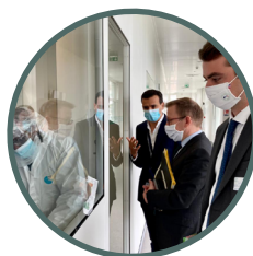
Yposkesi, Corbeil-Essonnes, 7/07