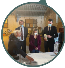
Ancienne halle SNCF, Lardy, 10/05