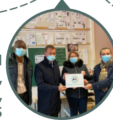
Groupe scolaire Paul Langevin, Grigny, 15/05