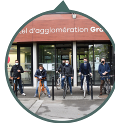
Grand Paris Sud, Evry, 04/05