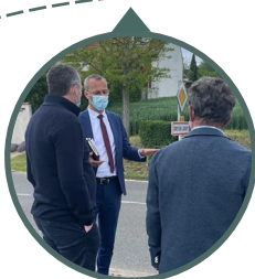
Liaison douce, Breux-Jouy, 30/05