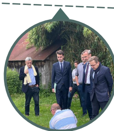
Parc Naturel Régional du Gâtinais, Milly-la-fôret, 6/07