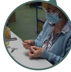
Drago, Palaiseau, 28/04