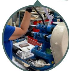
Senior Calorstat, Dourdan, 1/07