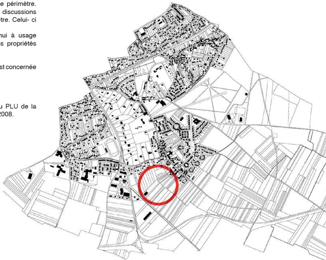
Localisation de La ZAC, à l'échelle de La Norville

La plus grande partie du site est classée en secteur AU du PLU de la commune, approuvée par le Conseil Municipal le 24 Janvier 2008.