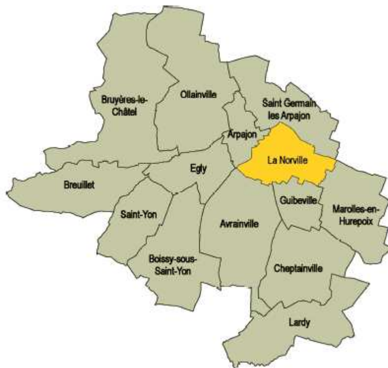
Localisation de La Norville, à l'échelle de la communauté de communes

Localisée au centre du département, La Norville est une commune dont le territoire s'étend sur une superficie d'environ 457 ha.