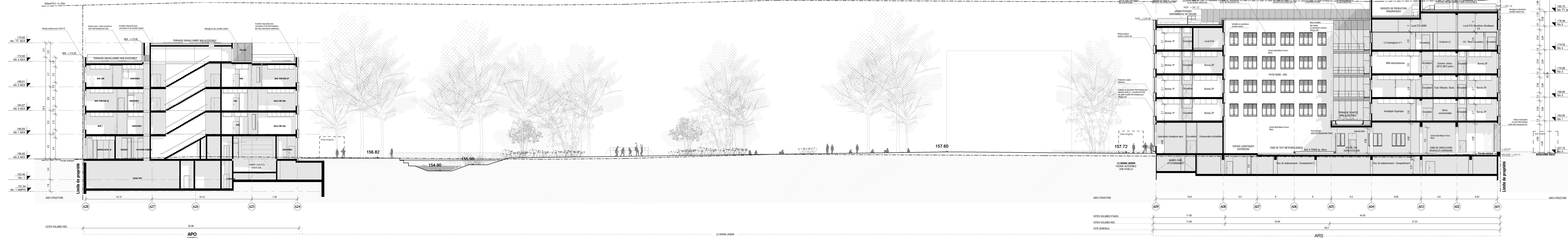
COUPE_TRANSVERSALE_Agro-Executive / AgroRecherche Sud 3 1:200