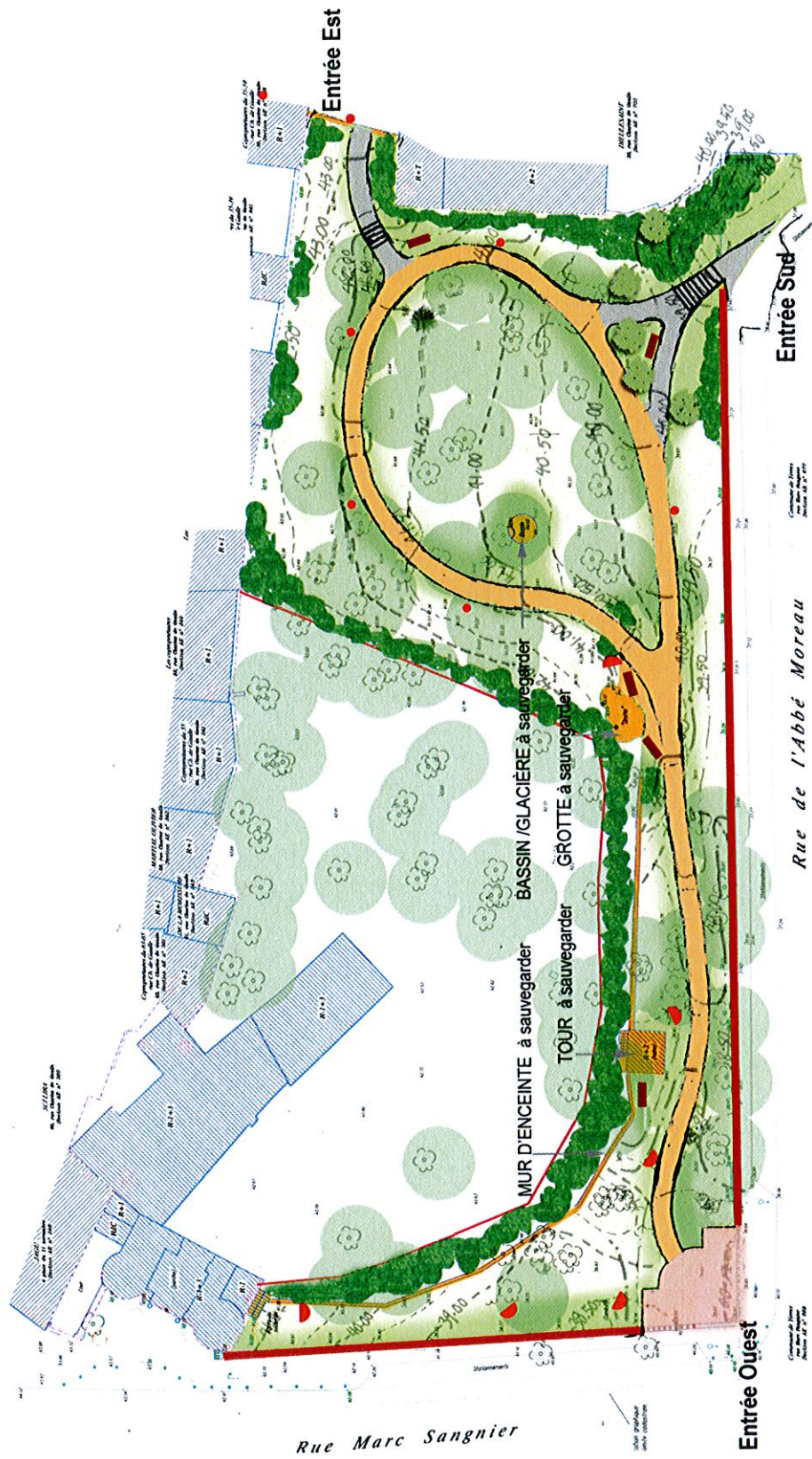
Figure 7 : Projet d'aménagement du Parc du Château Budé, schéma de principe