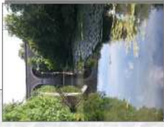
L'Yverres à Brunoy