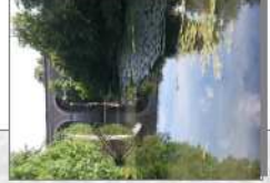
L'Yverres à Brunoy