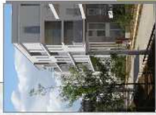
Quartier Camille Cludel Palaiseau