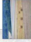
PNR du Gâtinais français